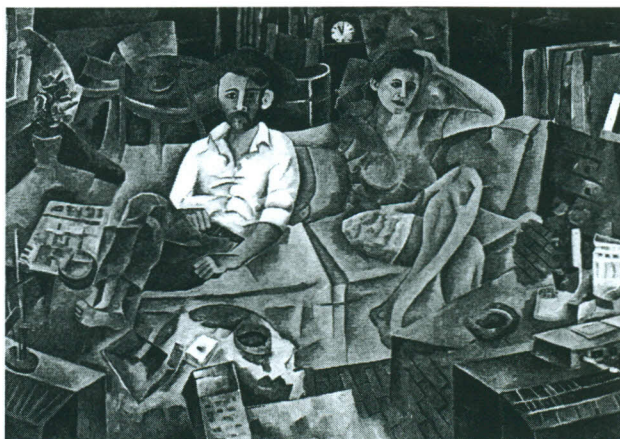
N. Οικονομίδη, Συζυγική ζωή.

Οι ανθρωπογραφίες του Οικονομίδη εμφανίζονται με μια διάσταση κατακερματισμού, όπως κατακερματισμένη είναι και η εποχή στην οποία ζούμε. Τα σώματα είναι διαμελισμένα, οι φιγούρες του πάσχουν από μοναξιά και αλλοτρίωση, η αποξένωση είναι εμφανής: οι άνθρωποι συνυπάρχουν στον ίδιο χώρο-πίνακα, χωρίς να διασταυρώνουν καν το βλέμμα τους. Φαίνεται σαν να κοιτάζουν το κενό, σαν να μην κοιτάζουν πουθενά. Είναι βυθισμένοι στο εγώ τους, τείχη πελώρια υψώνονται γύρω τους, το εμείς δε λειτουργεί. Κάποιες φορές το πρόσωπο είναι κενό, άδειο, όπως άδεια είναι και η ψυχή. Μια ιδιότυπη θλίψη τους κατακλύζει. Η μνήμη δεν τους βοηθάει. Είναι κι εκείνη γκρίζα, κενή.